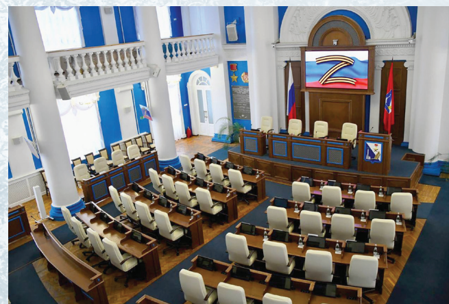
Зал Заксобрания Севастополя

Так, 27 февраля 2022 г. Турция, сославшись на 19 статью Конвенции Монре 1936 г. перекрыла проливы для военных кораблей всех государств, иден-