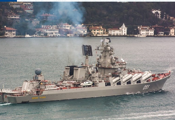
Крейсер «Маршал Устинов» на Босфоре

русско-турецких соглашений пропуска русских кораблей в Средиземноморье. Уже через несколько лет в результате целенаправленной деятельности английская дипломатия навязывает Порте в 1809 г. Договор о мире, торговле и секретном союзе. По нему Османская империя принимала обязательства по закрытию проливов в мирное время для военных кораблей всех стран. Русский флот был заперт в Черном море. А. Воронцов сформировал принцип функционирования Черноморских проливов, который более чем 100 лет лёг в основу Конвенции Монтрё, действующей до сегодняшнего дня.