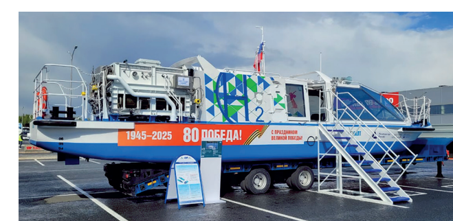
Водородное судно проекта 00393 на форуме «Россия – Исламский мир: KazanForum»

В 2025 году Зеленодольский завод имени А.М.