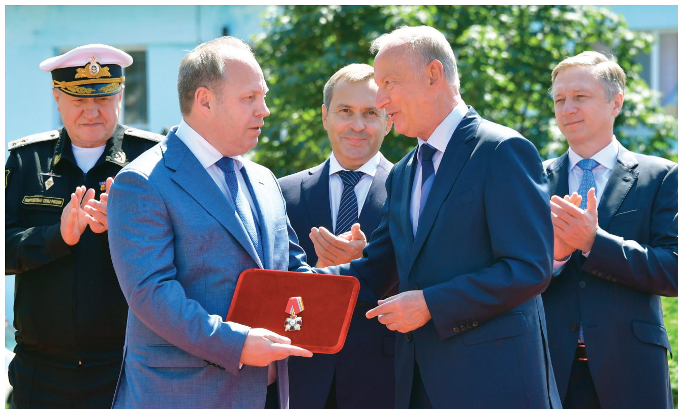
Вручение Ордена Российской Федерации «За доблестный труд» коллективу Зеленодольского завода имени А.М. Горького

В 2025 году успешно завершило прохождение испытаний первое в России инновационное судно