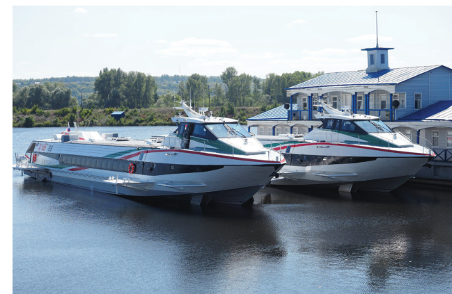
Скоростные пассажирские суда проекта 03830 «Метеор-2020»